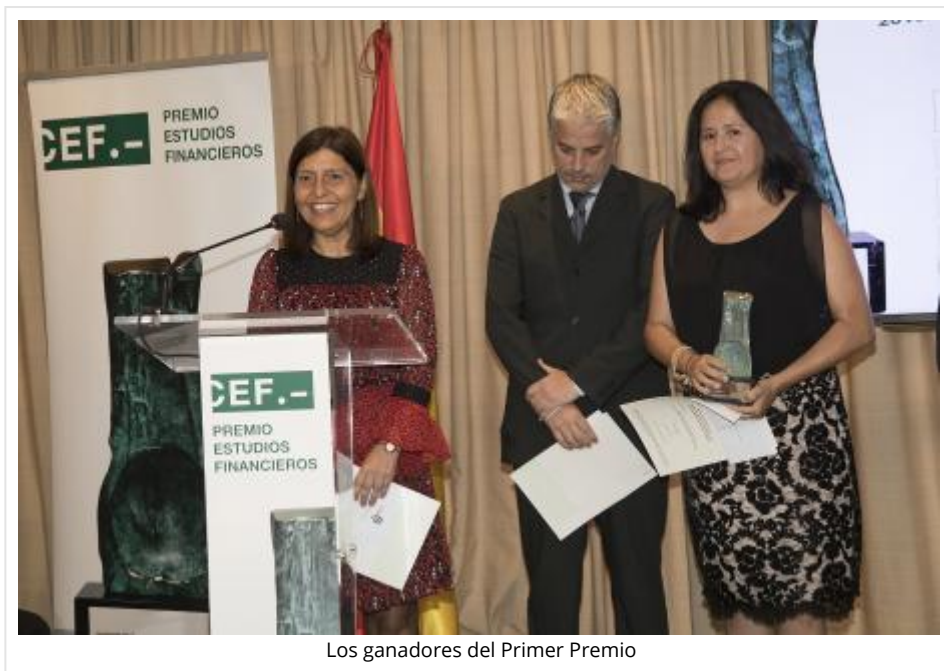
Los ganadores del Primer Premio